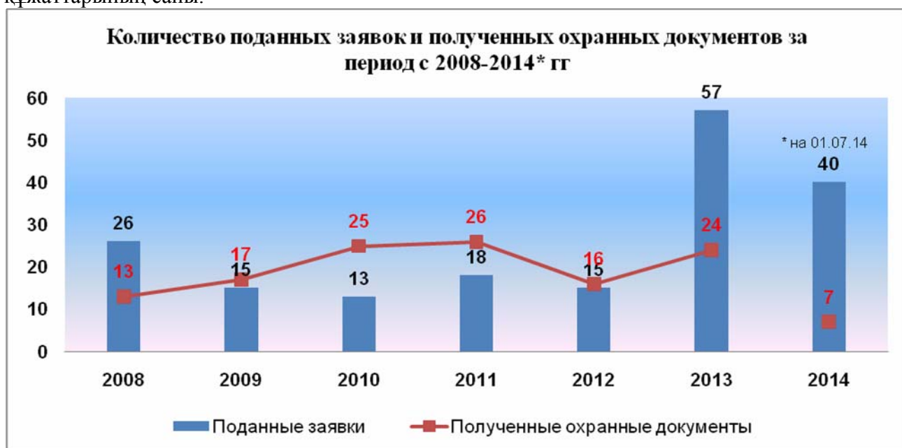
Диаграмма 1. 2008-2014 жж* кезеңіндегі берілген өтінім және алынған қорғау құжаттарының саны.