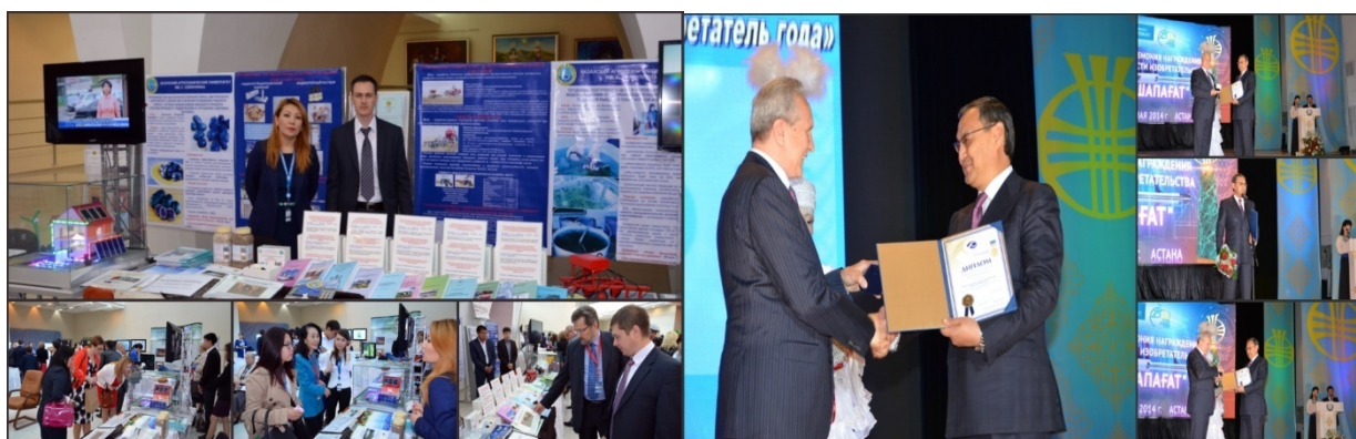
2 сур. Перспективалық өнертабыстар мен зерттемелердің көрмесі "Шапағат" - 2014"