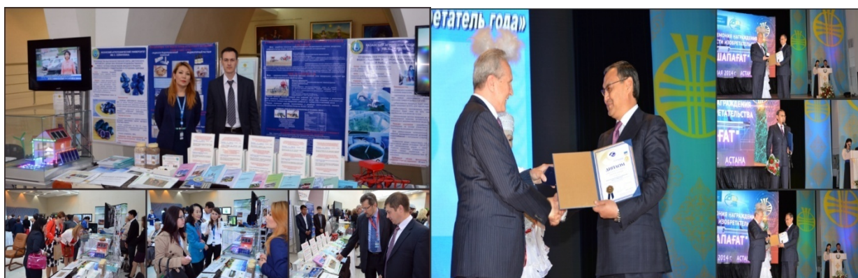
2 сур. Перспективалық өнертабыстар мен зерттемелердің көрмесі "Шапағат" - 2014"