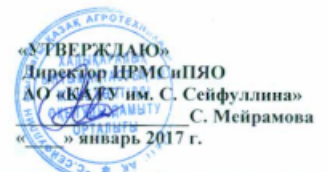
График открытых занятий преподавателей, ведущих занятия на английском языке в группах полнязычного образования за II семестр в 2016-2017 учебном году